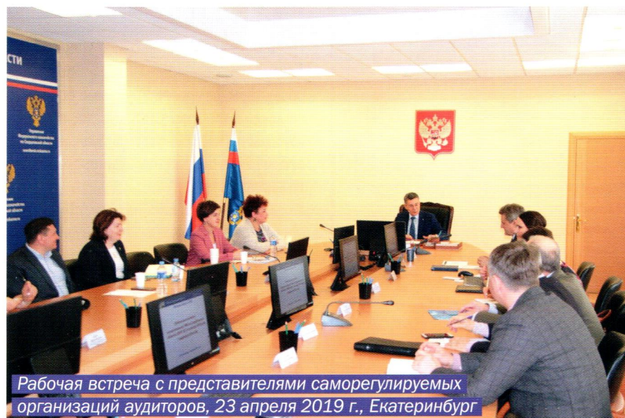
Рабочая встреча с представителями саморегулируемых организаций аудиторов, 23 апреля 2019 г., Екатеринбург

Таким образом, на официальном интернет-сайте УФК размещает: краткую информацию о результатах проверок (в срок не позднее пяти рабочих дней со дня подписания актов проверок), статистическую информацию (ежеквар-