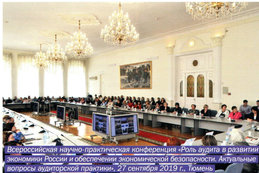
Всероссийская научно-практическая конференция «Роль аудита в развитии экономики России и обеспечении экономической безопасности. Актуальные вопросы аудиторской практики», 27 сентября 2019 г., Тюмень

В целях информирования заинтересованных групп пользователей о ВКР АО, вопросах, обращающих на себя внимание при его осуществлении, в частности о рисках, возникающих в деятельности аудиторских организа-